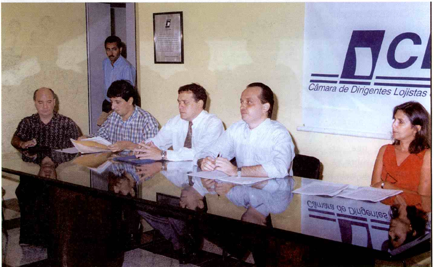
Diretores Lojistas analisam o conteúdo do convênio, que vai possibilitar créditos a taxas mais baixas

O Banco do Brasil (BB) e a CDL de Teresina assinaram no último dia 03 de maio o acordo que beneficia os associados da entidade em determinadas transações financeiras com o banco.