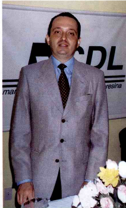
O presidente da CDL no dia da inauguração do novo auditório

A reorganização do "layout" da CDL complementa as reformas que